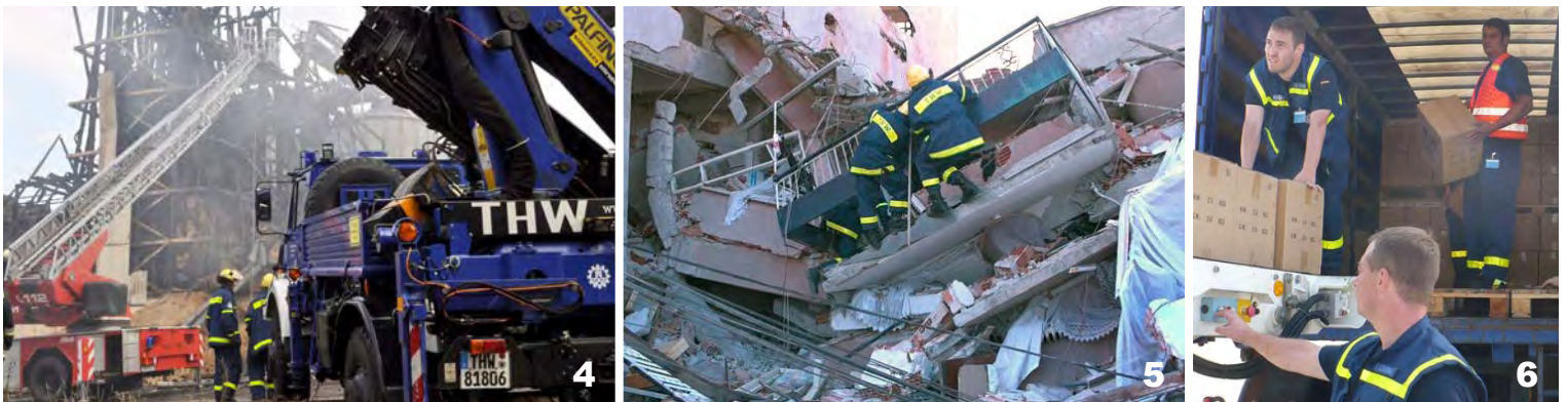
Orman yangınları (2010): 6 Rusyaya THW-Solunum Maskesi