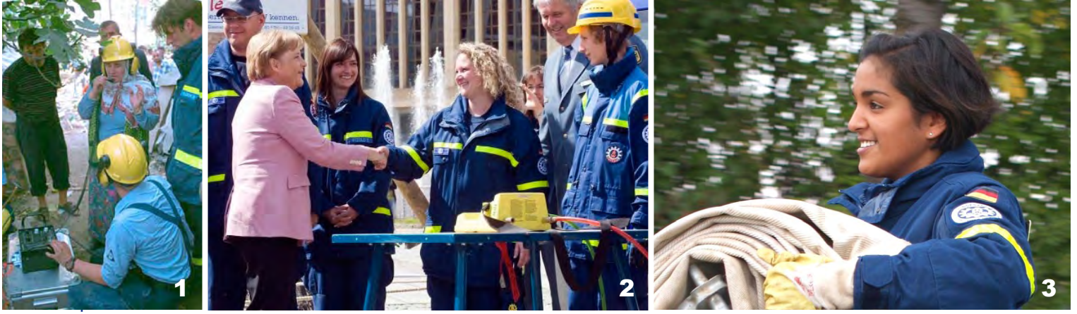
Türkiyedeki deprem (1999): 1 Enkaz altındakiileri arama